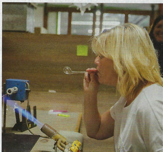
Manželka prezidenta České republiky Eva Pavlová si při návštěvě sklárny Koulier vyzkoušela, jak náročné je foukání skleněných ozdob.