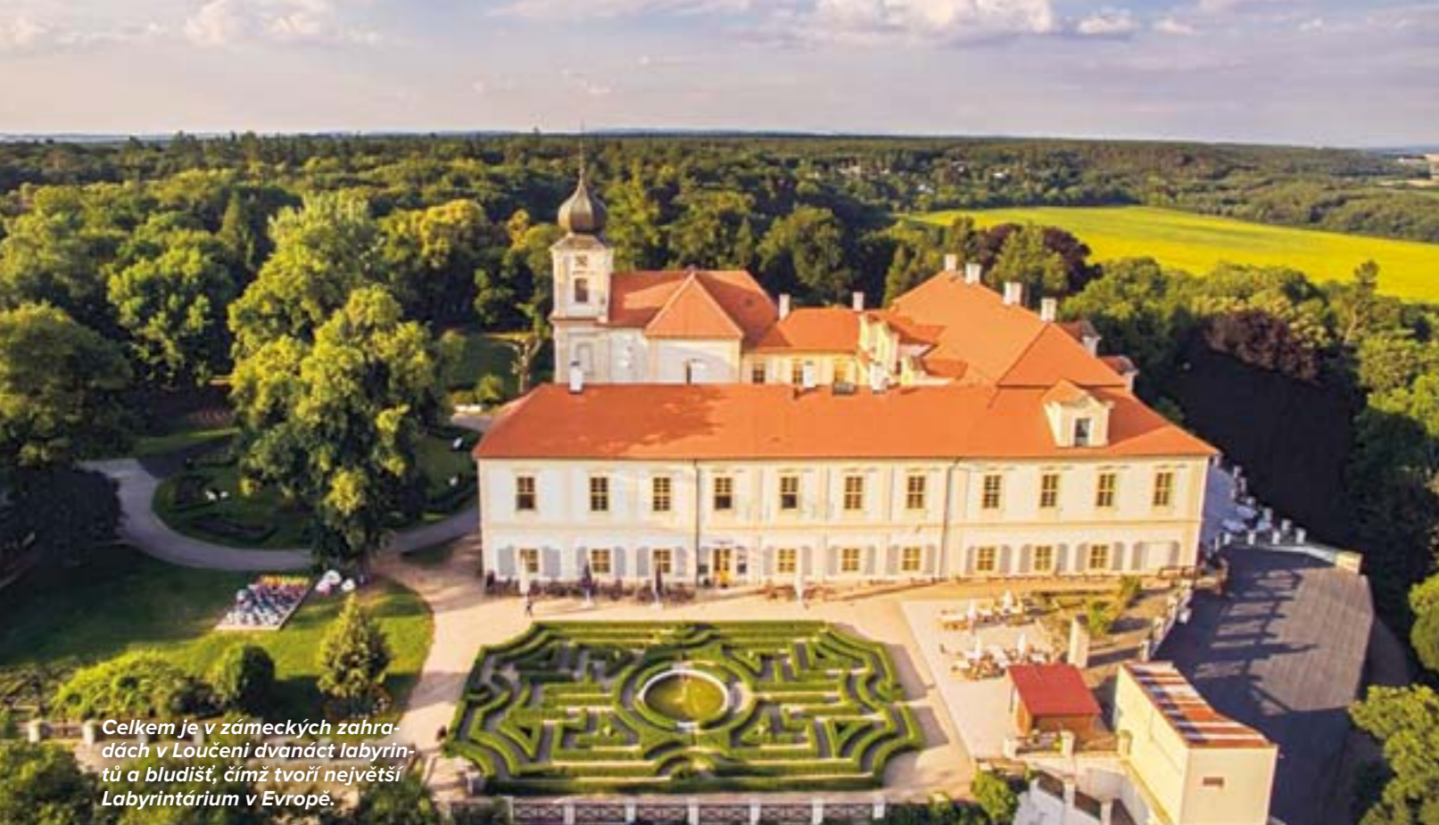
Celkem je v zámeckých zahradách v Loučeni dvanáct labyrintů a bludišť, čímž tvoří největší Labyrintárium v Evropě.